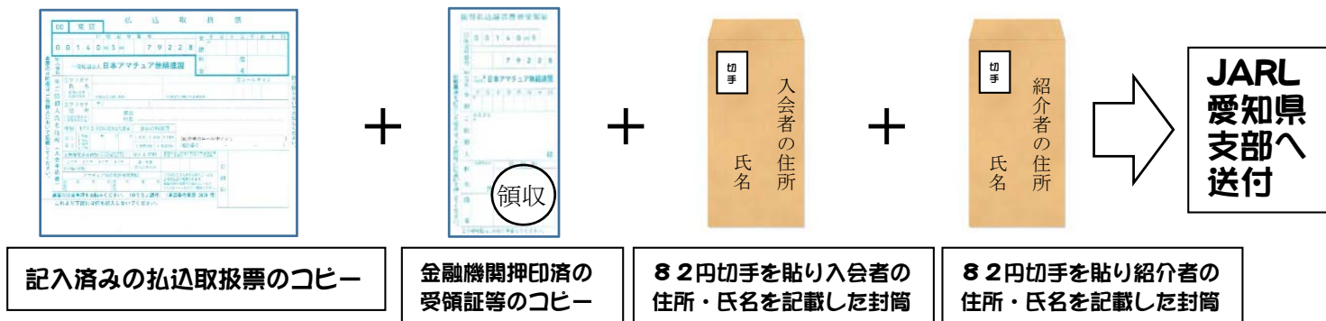
図4 郵送による手続き