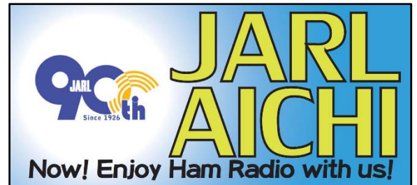
図1 JARL 愛知県支部特製ステッカーの一例

2015年4月1日（水）から7月12日（日） （JARL 愛知県支部大会の日）まで