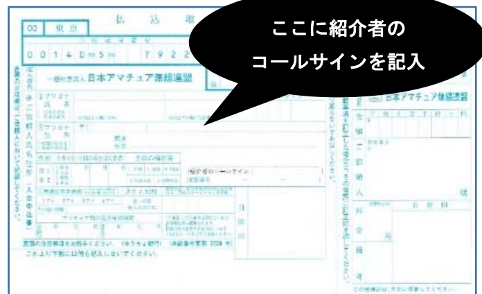
図2 入会申込書。JARL 事務局へ連絡すると入手できます。会場の JARL 受付デスクにも用意します。

対象の方と紹介者が揃って JARL 受付デスクで指定の申込書を提出してください（紹介者のコールサイン記入も忘れずに）。お手元に届いた会員継続等の振込用紙で申込可能です。すでに送金済みの場合は領収証書部分のコピーを必ず持参してください。青少年お試し入会キャンペーンや会費（入会金を含む）を納入いただいた入会・継続者にも記念品を贈呈します。また、紹介者にも記念品を贈呈します（JARL 会員証を必ず提示してください。提示がない場合は贈呈しません。JARL 会員証をお忘れないようにお願いします）。