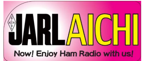
図1 JARL 愛知県支部特製ステッカー（予定）