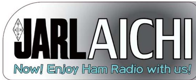
図 1 JARL 愛知県支部特製ステッカー (2020 年度予定)

JARL 愛知県支部では、2020 年度に開催される JARL 愛知県支部大会・第 52 回東海ハムの祭典などの支部行事において、下記の会員増強企画を実施します。新たに JARL へ入会する方だけでなく、紹介いただいた方へも記念品を贈呈します。記念品は、JARL 愛知県支部特製ステッカーを予定しています。