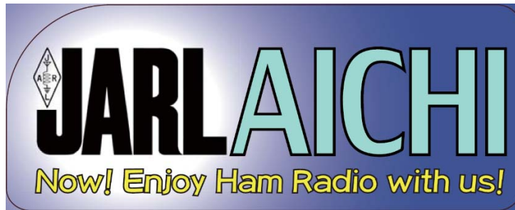
図 1 JARL 愛知県支部特製ステッカー (2022 年度)

JARL 愛知県支部では、2022 年度に開催される JARL 愛知県支部大会・第 54 回東海ハムの祭典などの支部行事において、下記の会員増強企画を実施します。新たに JARL へ入会する方だけでなく、紹介いただいた方へも記念品を贈呈します。記念品は、JARL 愛知県支部特製ステッカーを予定しています。