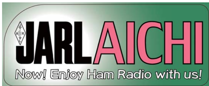
図 1 JARL 愛知県支部特製ステッカー（2023 年度）

JARL 愛知県支部では、2023 年度に開催される JARL 愛知県支部大会・第 55 回東海ハムの祭典などの支部行事において、下記の会員増強企画を実施します。新たに JARL へ入会する方だけでなく、紹介いただいた方へも記念品を贈呈します。記念品は、JARL 愛知県支部特製ステッカーを予定しています。