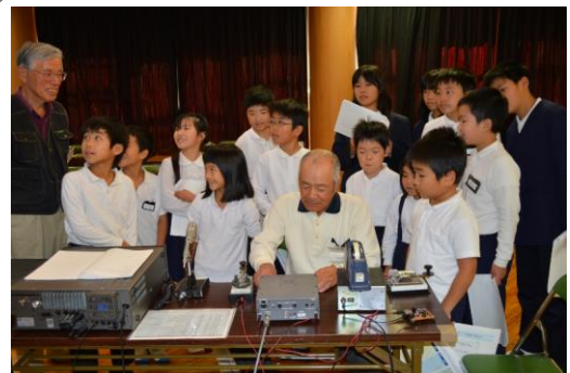
(電信に興味深く見守る子供たち)

子供たちに災害時のアマチュア無線の重要性や楽しみ方について、町内の小学校へ「出前授業」を展開している当クラブは昨年3月・10月に引き続き3月9日(月)に3校目となる広田地区の玉谷小学校で行います。初めて体験する子供たちは無線の理解と楽しみ方に目を輝かせて真剣に学んでいます。また閉局したOM諸氏から無線機を提供していただき、中・高校生の免許取得者に譲渡するなど青少年事業に努めています。