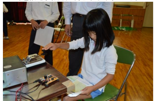
(模擬電信で楽しむ)