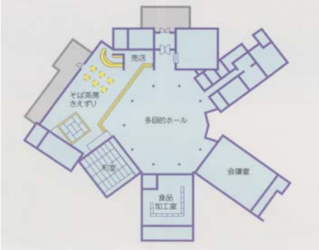
健康の森の活動拠点として整備され、多目的ホールや会議室・和室などがある施設です。