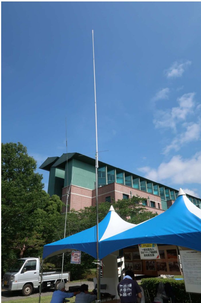
JARL 高知県支部ブースのアンテナ設置完了