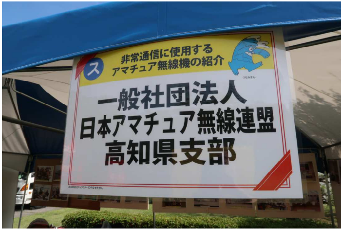
JARL 高知県支部のブース設置