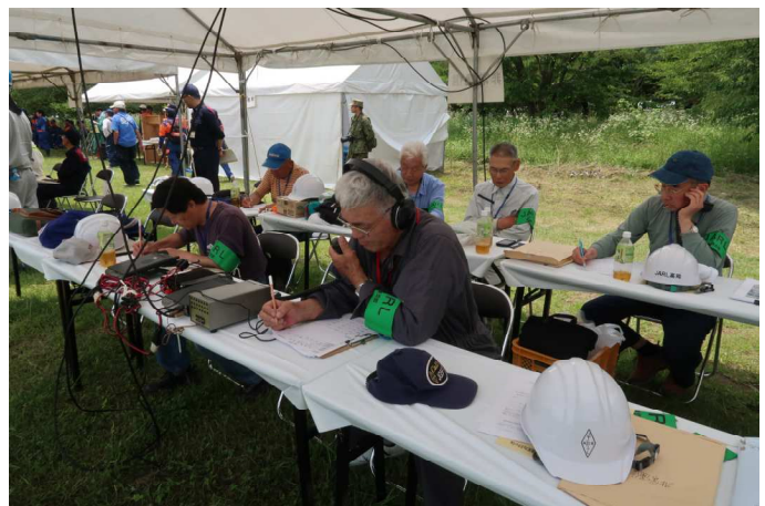
いよいよ非常通信開始