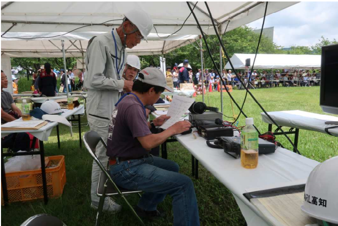
訓練場で非常通信の順位を確認中