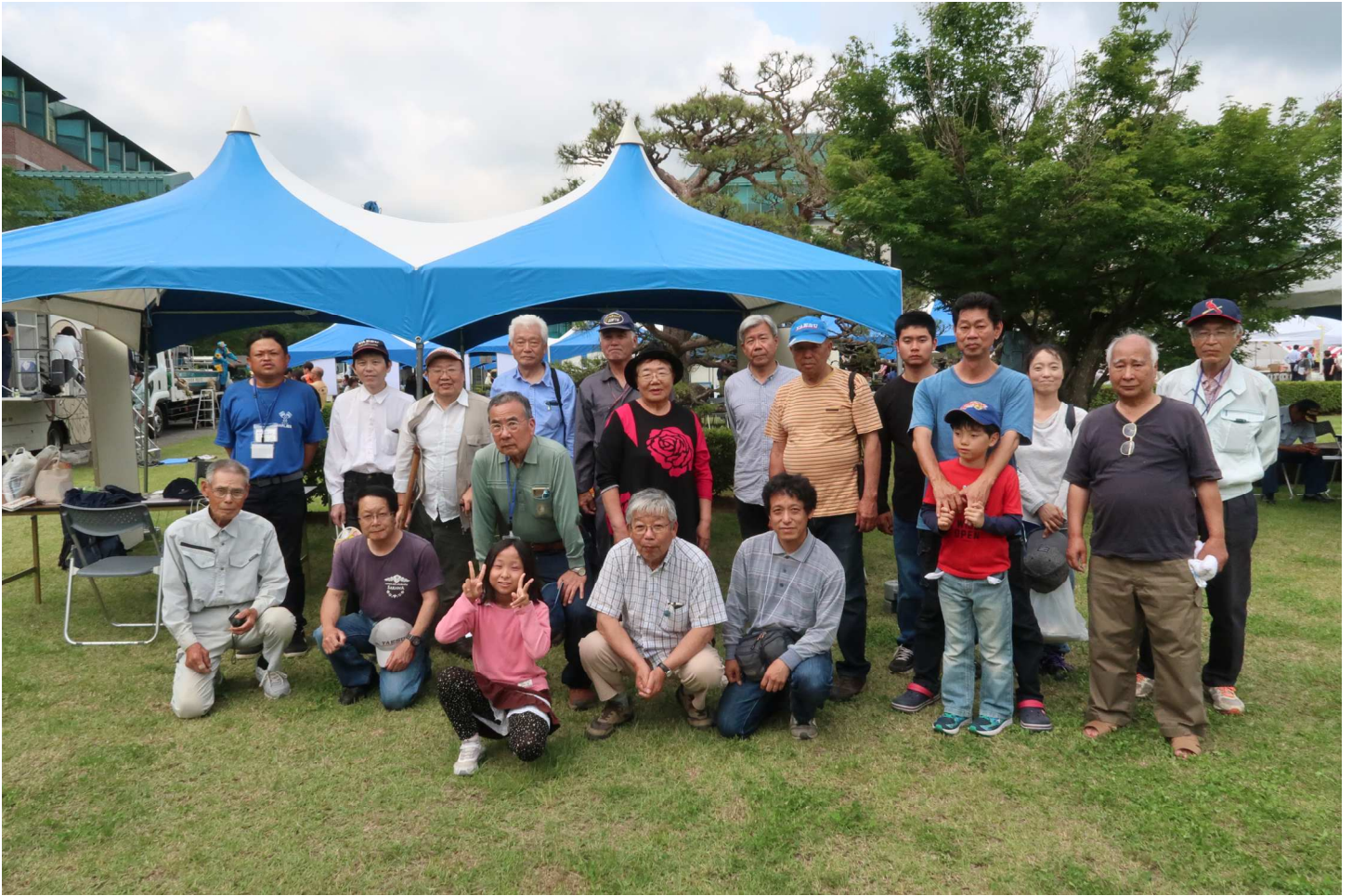
高知県防災訓練の非常通信参加者一同

高知県は災害の多い県でも有りますので参加者全員、災害時にはアマチュア無線で被害状況等の報告、連絡が必要になるとの思いをいっそ強く感じて今回の高知県防災訓練に参加してまいりました。