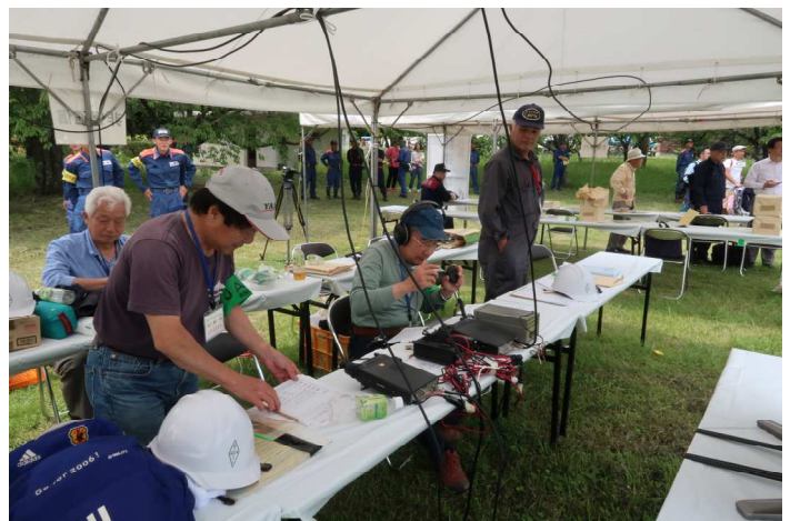
確認した要請を記入確認中