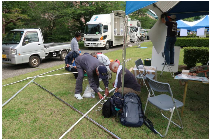
アンテナを設置中