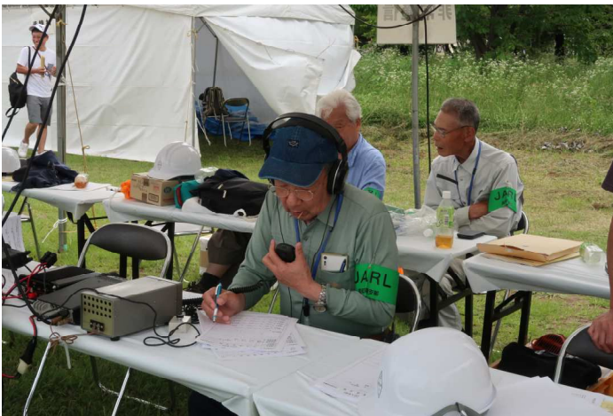
市町村からの要請を受信中