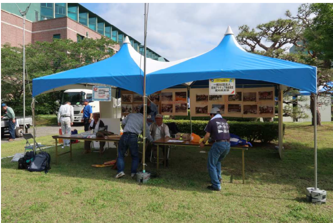
JARL 高知県支部ブース設置完了