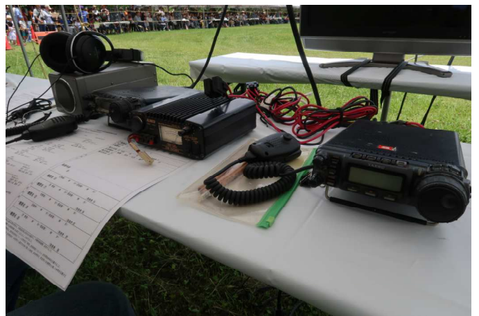
訓練場で無線機も設置完了