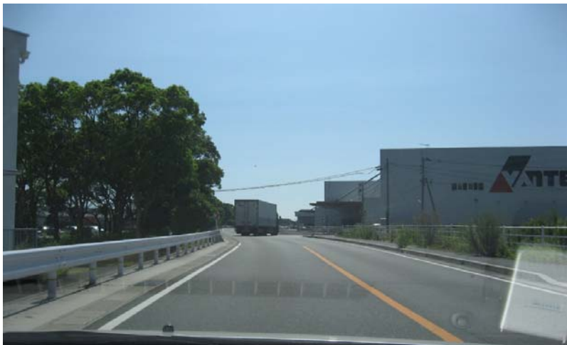
(11)もう少し進むと、「VANTEC」の建屋がある