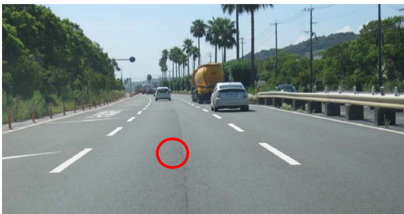
(6) 「日産自動車」交差点を過ぎると道路が2車線になり、その先に左折専用の車線があるが、左折専用車線に入らず、 ○ 印の車線をキープする