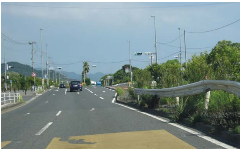
(6) 左に急カーブしたあと「白石工業団地入口」 交差点を右折する