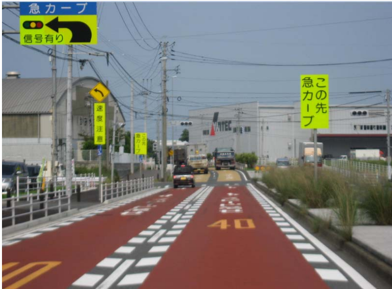
(4) もう少し進むと、急カーブのサインがある このあたりから、右車線をキープすること