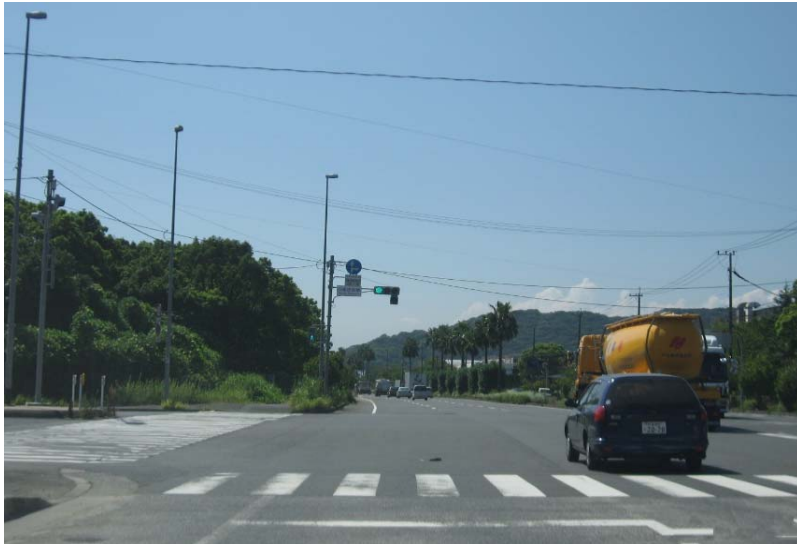
(5) 「空港 IC入口」交差点からおよそ5kmで「日産自動車」交差点があるが、直進する