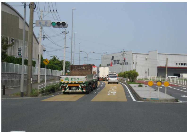
(5) ここが「白石」交差点 この先、大きく左に急カーブしたあと すぐに交差点があり、右折するので ここでは右の車線をキープしておく 目前に「VANTEC」の建屋が見える