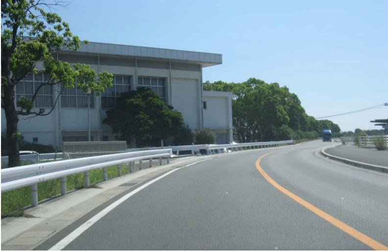
(7)「白石工業団地入口」交差点を右折すると すぐ目の前に目的の日産体育館が見える