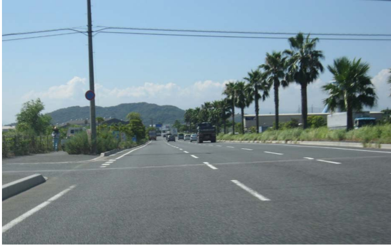
(4) 南洋風の街路樹が続く