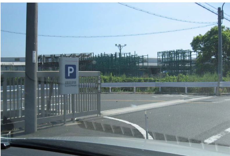
(9)「VANTEC」の建屋の真ん前あたりに 会場入口がある 目的地終点です