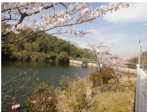
大川ダム(ダムの職員さんも無線家)