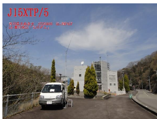
発行 Q S Lカード