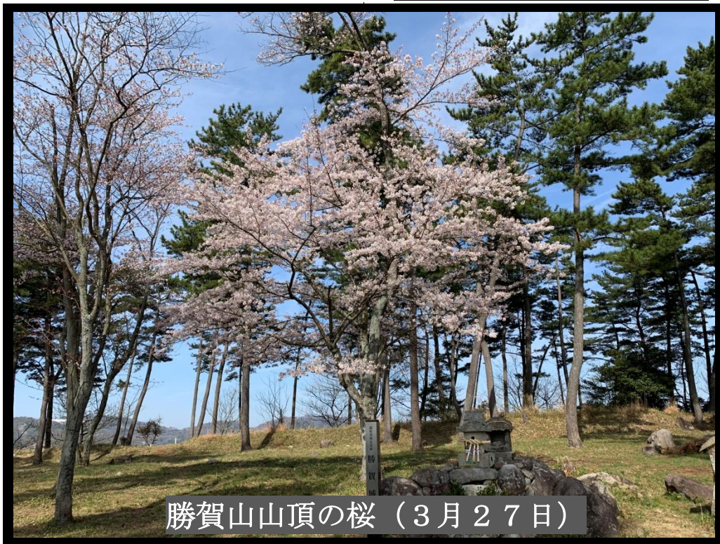
勝賀山山頂の桜（3月27日）