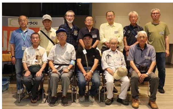
後列 JJ8KTT JH8MCT JE8HLA JE8OGI JA8IRQ JA8EGS JM8RWB 前列 JH8NNW JH8CBH JA8DHR JL8JUK JA8EJZ