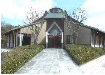
出雲国際交流プラザ・会館