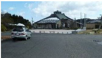
(出雲国際交流プラザ)