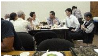
~~ 懇 談 ~~