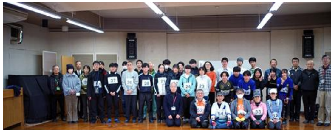
静岡県支部A R D F 競技大会兼静岡県高等学校A R D F 競技大会 掛川市 高天神跡周辺 R7. 12. 14